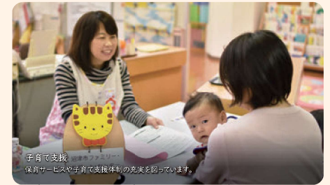
子育て支援 保育サービスや子育て支援体制の充実を図っています。

市民が住み慣れた地域で、心身ともに健康な毎日を送れることは、最大の福祉です。 安心して子供を生み育てることができるまち。年齢や性別にかかわらず、誰もが快適に過ごせるまち。そして、生涯を通じての健康づくりと保健予防対策を進めるまちにしていきたいです。 長寿社会に対応した介護保険制度の適切な運用、在宅福祉や生きがいづくりの充実、福祉施設の整備、ユニバーサルデザインの視点を導入した助け合いのコミュニティづくりなども推進していきます。