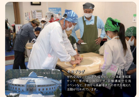
千本ブラザ 世代交代センター、認知症センター、高齢者就業センター等の複合施設です。各種講座や交流イベントなど、子供から高齢者までの世代を超えた活動が行われています。