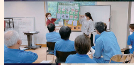
保健センター 乳幼児から生涯を通じて健康づくりの拠点としての役割を担っています。