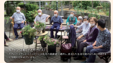
生きがい活動(デイカービス) 市内のデイサービスセンターには在宅の高齢者が通所し、自立した生活を送るためにさまざまな活動が行われています。