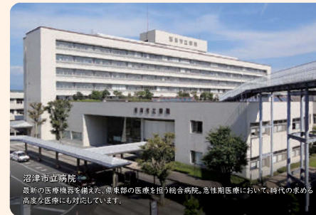
沼津市立病院 最新の医療機器を備えた、県東部の医療を担う総合病院。急性期医療において、時代の求める高度な医療にも対応しています。