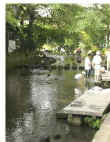
【夏の源兵衛川(三島)】