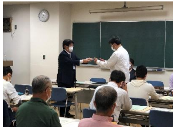
【5/12 補導委員会代表者会：委嘱状交付】

沼津市補導委員会は、令和5年度から18地区の「青少年を健やかに育てる会」から推薦される少年補導委員により構成されています。各地区の「青少年を健やかに育てる会」推薦の少年補導委員は222名です。