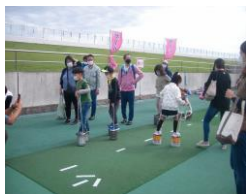
【子供の遊び王国 in 沼津】

秋には、子供たちが1日中楽しめる「子どもの遊び王国 in 沼津」の開催が予定されています。現在、多くの皆様が、多忙の中、時間を割いて集まり、当日に向けて、必要な資材の手配、役割の分担、実行委員会の開催など、様々な準備が進められています。