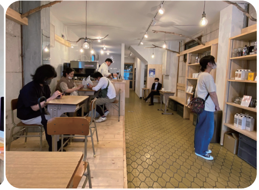
チャトラコーヒー

沼津市では、2015年から始まったリノベーションまちづくりの取組により、多くの事業や活動が創出されてきました。そのネットワークが広がり、沼津を楽しむ人たちが、市内のあらゆる場所で増えてきています。遊休不動産を活用するひと、しないひとに関わらず、新しい展開/活動が生まれています。また、今後本格化する沼津駅周辺のまちづくりにおいては、ウォークアブル（居心地が良く歩きやすい）なまちを目指していくこととされています。