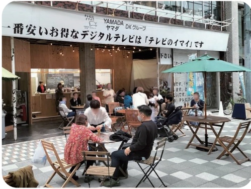
PASO と沼津新仲見世商店街