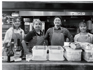
Baker's Dozen (ベーカースダズン) 沼津市町方町9-1 (日曜定休・月曜不定休) ☎055 954 2266