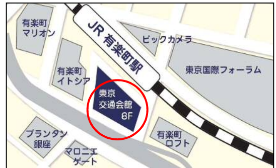
JR山手線・京浜東北線 有楽町駅徒歩1分

東京交通会館 8階 NPOふるさと回帰支援センター （東京都千代田区有楽町2-10-1）