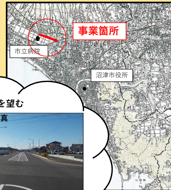
富士交通交差点から西側を望む