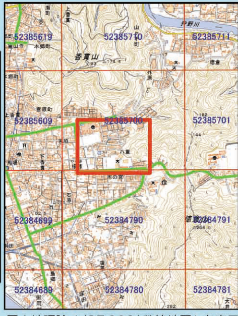
国土地院 1/25,000 (数値地図) を表示