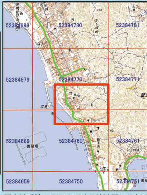
国土地理院 1/25,000(数値地図)を表示