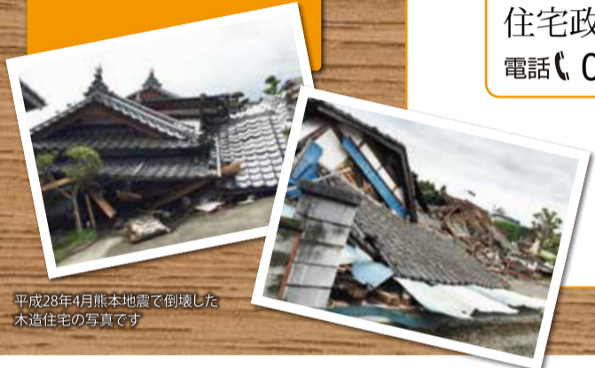
平成28年4月熊本地震で倒壊した木造住宅の写真です