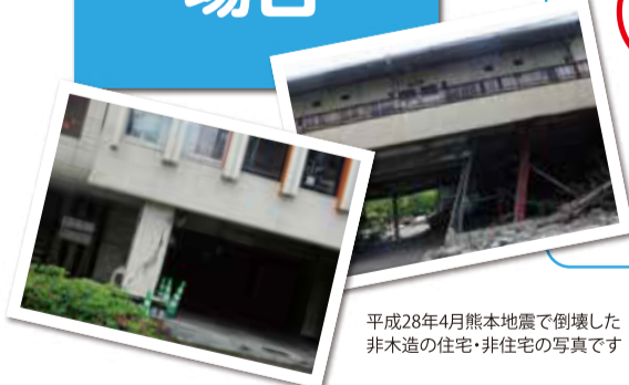
平成28年4月熊本地震で倒壊した非木造の住宅・非住宅の写真です