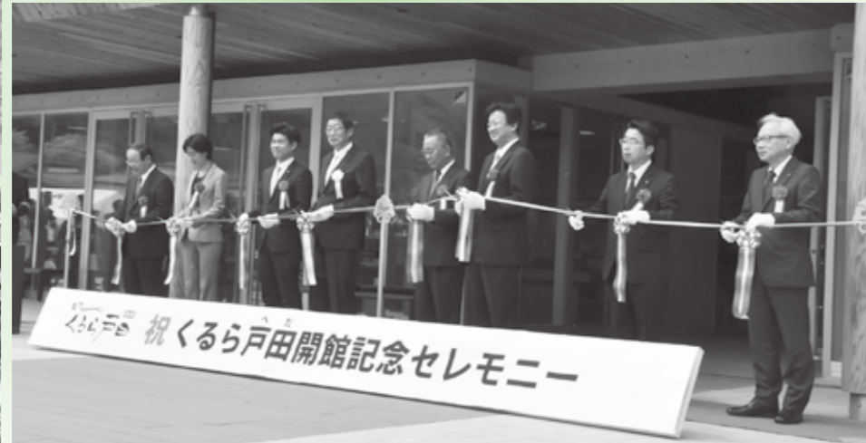
6月28日に行われたセレモニー

「くるら戸田」は戸田地域の雇用の確保に繋がる施設となるほか、地元住民の活動拠点として、また交流を深める場として活用していくと共に、自然環境や歴史、観光等の戸田の魅力を全国に発信する絶好の地域振興施設として、地域活性化のシンボリック役割を果たしていきます。