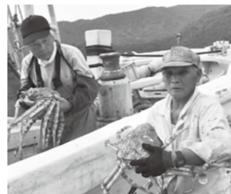
戸田地域の一次産品を沼津で加工したり、販売したりする等、産業分野で融合的な取り組みを行っています

合併直前の平成16年度に行った「沼津市・戸田村の新しいまちづくりに関する住民アンケート調査」で、戸田地域で力を入れるべき施策として当時の戸田村の皆さんは、道路整備や雇用の確保、自然環境を利活用した観光や医療・福祉の充実を求めています。このような声を反映させるため、市では今日まで様々な施策に取り組みと共に、これまで沼津市が培ってきた商業や文化、高次都市機能の集積力と戸田村が持つ自然環境や歴史、観光等の魅力を有機的に結びつけていくためのまちづくりを進めてきました。