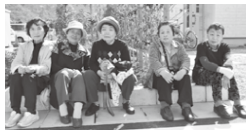
踊りの会「咲かす紅」の皆さんとそのお友だち

合併したことで素晴らしい施設ができました。「くるら戸田」の温泉や高齢者交流ルームを地域のみならず利用するのが楽しみです。観光客とも交流を深め、戸田の良さを伝えていきたいです。