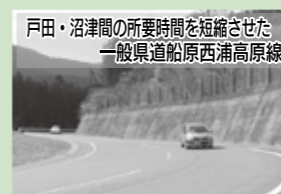
戸田・沼津間の所要時間を短縮させた一般県道船原西浦高原線