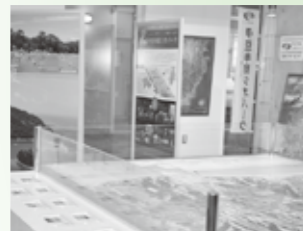
戸田の魅力を発信「観光情報コーナー」