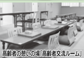
高齢者の憩いの場「高齢者交流ルーム」