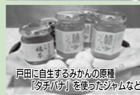
戸田に自生するみかんの原種「夕チバナ」を使ったジャムなど