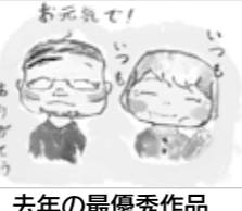
去年の最優秀作品