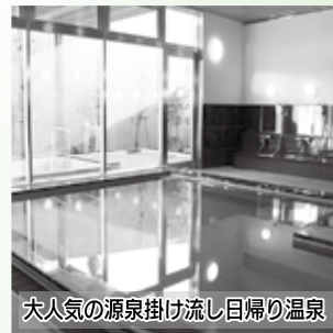
大人気の源泉掛け流し日帰り温泉

平成17年に沼津市と戸田村が合併し今年で10年が経ちました。市では「沼津と戸田の2つの個性を融合させ、人が行き交うまち」を目指して、様々な施策を展開してきました。 今回の特集は合併10周年を記念して、これまでの取り組みと戸田地域の活性化へのシンボルとしてオープンした「くるら戸田」について、地域の皆さんへのインタビューと共に紹介します。 ◎政策企画課 0555・934・4798