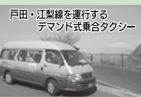
戸田・江梨線を運行するデマンド式乗合タクシー