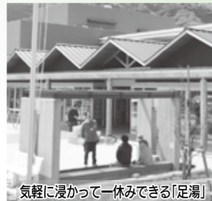
気軽に浸かって一休みできる「足湯」

「くるら戸田」は合併時に策定した新市建設計画の主要事業として整備され、平成26年10月には道路利用者の休憩、情報提供、地域連携の場となる「道の駅」に登録されました。施設の外観は日本の近代造船発祥の地である戸田にちなんで洋式帆船「ヘタ号」をモチーフとし、1階には日帰り温泉、戸田の観光情報や歴史・文化を紹介する展示室、海産物など特産品を揃えた物販コーナーが設置されたほか、戸田市民窓口事務所や高齢者交流ルームが設けられ、2階には戸田地区センター、3階には防災倉庫等が備えられました。