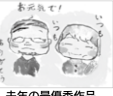
去年の最優秀作品