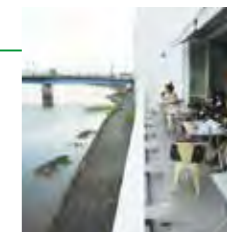
▲川辺のカフェ ▼蔵を改修した店舗