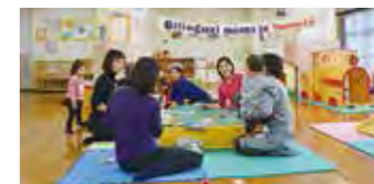
▲子育てサークルの活動

対象 市内でまちづくり活動に取り組む個人または団体 事業例 子育てママや高齢者のコミュニティやネットワークづくり、新しい感覚の起業や雇用の創出支援、沼津の新たな魅力の掘り起こし、公園・河川など公共空間を活用したにぎわい創出 など