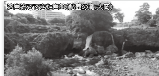
溶岩流でできた岩盤(鮎島湾・大岡)

ジオパークは地層や火山など、地球(ジオ)の成り立ちを観察でき、学術的・文化的に貴重な自然公園です。観光や教育分野等での活用による地域振興が期待されます。本市を含む伊豆半島7市8町が加盟する「伊豆半島ジオパーク推進協議会」が設立され、伊豆半島が隠岐や阿蘇のように世界ジオパークネットワークの認定が受けられるよう取り組んでいます。