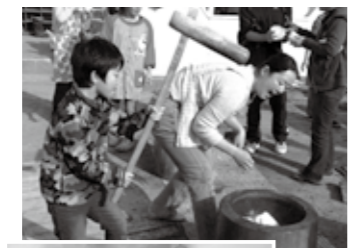
▲餅つきにも気合が入ります。 ▲巨大なやぐら

地域の一大イベントです。地域の皆さんの協力で児童と共に竹取りから始まり、学校の運動場に組まれた大きな二つのやぐらから炎が空高く舞い上がります。豚汁作りや餅つき、綿菓子作りも行われ、来場者に振る舞われます。また、それらの給仕を子どもたちが手伝って地域のお年寄りが参加した「ことぶきサロン」に届けたことで、触れ合う機会にも恵まれました。