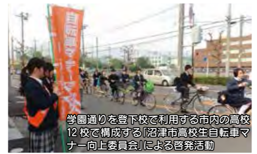
学園通りを登下校で利用する市内の高校12校で構成する「沼津市高校生自転車マナー向上委員会」による啓発活動