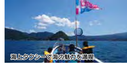
海上タクシーで海の魅力を満喫

沼津港の基盤整備を促進するとともに、海の魅力を満喫できるコンテンツを結ぶ沼津湾海上タクシー事業を新たに実施し、観光客の誘客とにぎわいの創出を図ります。