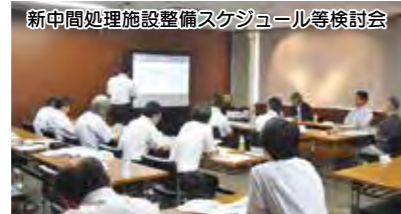
新中間処理施設整備スケジュール等検討会

建設予定地周辺の環境整備を進めるとともに、事業の早期再開に向け、関係機関との調整や事業手法の検討などに取り組みます。