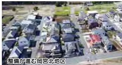
整備が進む岡宮北地区

災害に強く質の高い居住空間の創出を目指し、調整池や区画道路築造などの整備を進めます。