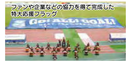
ファンや企業などの協力を得て完成した特大応援フラッグ

スポーツを通じた活気あるまちづくりを推進するため、J3アスルクラロ沼津を支援するとともに、ホームスタジアムの整備について県や関係機関と協議を進めます。