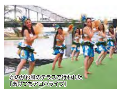
かのかわ風のテラスで行われた「あげつちアロハライブ」

まちづくりに取り組む団体等への支援をはじめ、中央公園や狩野川の水辺空間を活用した中心市街地のにぎわいづくりに取り組みます。