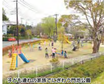
子ども連れの家族でにぎわう門池公園

沼津市パークマネジメントプランに基づき、市民との協働による公園の管理や活用、にぎわいづくりに取り組むとともに、中央公園の整備について公民連携による事業手法の検討を行うほか、山王公園のトイレ等の改修を行います。