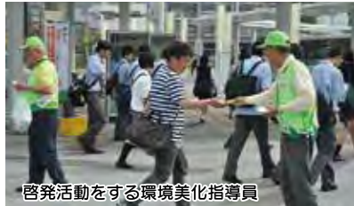
啓発活動をする環境美化指導員

環境美化指導員の活動を支援するとともに、昨年10月に施行した「沼津市路上喫煙の規制に関する条例」の周知・啓発に取り組みます。