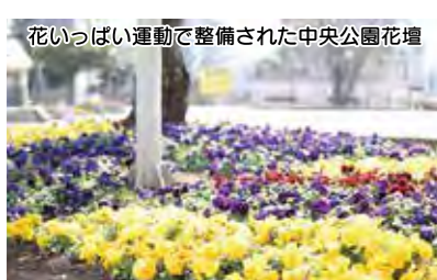
花いっぱい運動で整備された中央公園花壇