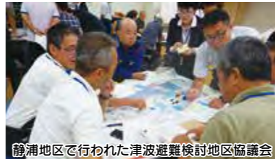
静岡地区で行われた津波避難検討地区協議会

津波避難路、津波避難ビルの整備に対して補助を行うほか、津波避難困難地区の解消に向けた津波対策計画の策定に取り組みます。