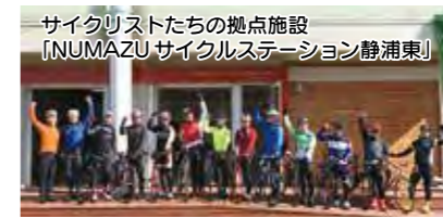
サイクリストたちの拠点施設「NUMAZUサイクルステーション静岡東」

自転車を通じた交流人口の拡大を図るため、サイクリストの受け入れ環境の整備やイベントの開催、レンタサイクルの運営などを実施します。