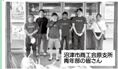
沼津市商工会原支所 青年部の皆さん

私たちの活動は、シンプルに道路のごみ を拾うこと。時間は30分くらいのこともあ れば、1時間以上行うこともあります。