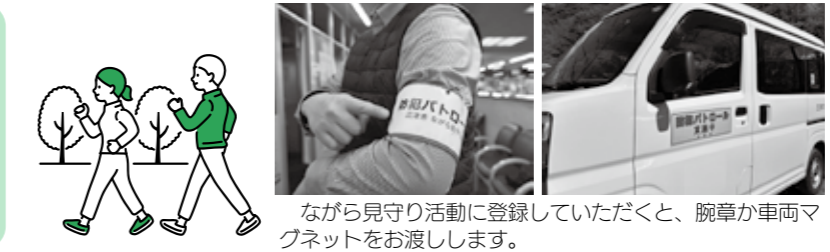
ながら見守り活動に登録していただくと、腕章が車両マ グネットをお渡します。

子供やお年寄りの安全を守るため、個人のライフスタイルや 事業者・団体等の事業活動に合わせて周囲の状況に気を配り、 不審者等がいたら警察に通報するボランティアの防犯パトロー ル活動です。