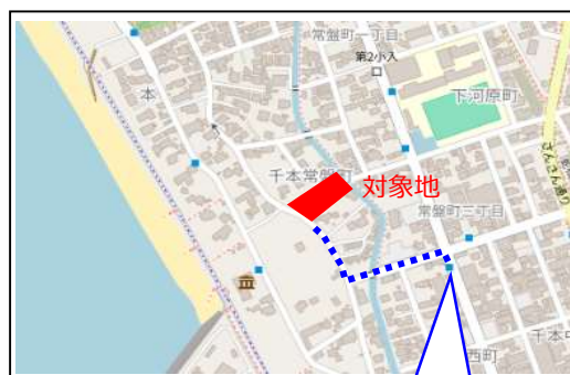
伊豆箱根バス 勝呂病院前停留所