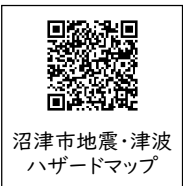
沼津市地震・津波ハザードマップ