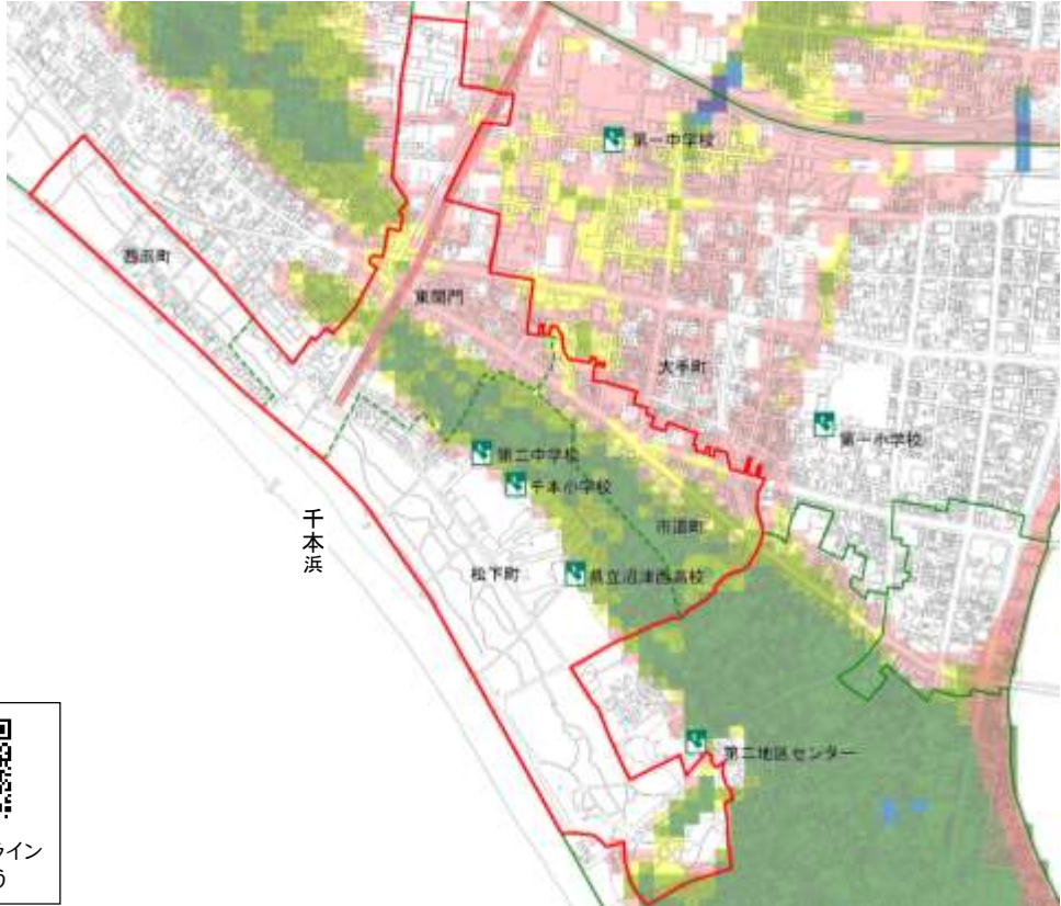
沼津市「マイ・タイムライン作成地区別ガイドライン」より

「土砂災害」の危険について ・第二・千本地区では、土砂災害の危険箇所はありません。