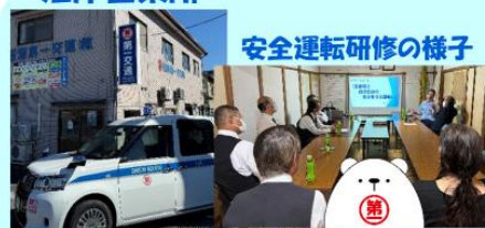
安全運転研修の様子