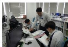
沼津事業所積算室

公共事業推進の仕組み、様々な発注者支援業務を行っているパブリックサービスですが、我々が提供しているものはただ一つの職員の持つ技術力や人間力という「人のチカラ」です。そのため、絶えず人材育成を行うとともに、活力ある職場環境の整備に努めています。