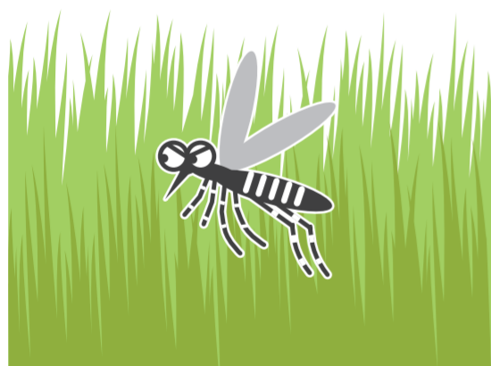
風通しの悪い やぶ・草むら

公園、学校、寺社、空海港、駅などの施設を管理されている方もご協力をお願いします!