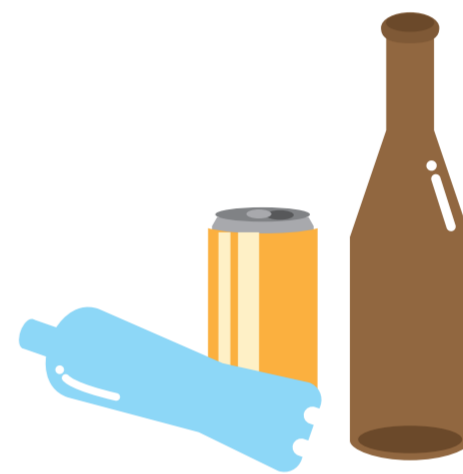
屋外に放置された空きビン・缶・ペットボトル