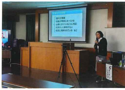
アドバイザー：県内外で地域活動のサポートや地域づくりについての講演活動を行っている「里山くらしLABO」