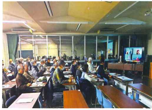
講義：「持続可能な地域活動を目指して」 時代に沿った組織作りと多様な参画 講師：里山くらしLABO