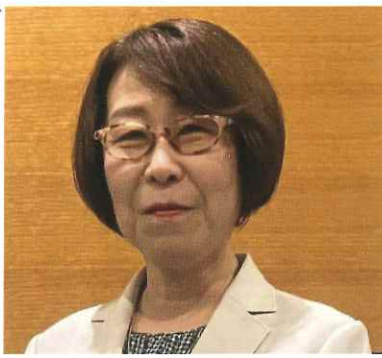
静岡大学グローバル共創科学部教授、静岡大学防災総合センター兼任教員