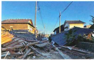
倒壊被害の様子

静岡県は南海トラフ地震の発生が想定されている場所なので、地震の被害は他人事ではありません。すでに発生した地震の被害から今後どのような準備をしていくべきか学ぶ必要があります。 耐震性の向上