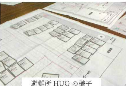
避難所 HUG の様子

参加し、避難所運営の疑似体験ができる防災ゲーム「避難所HUG」を男女共同参画の視点で行いました。男女共同参画視点で起こり得る問題が書かれたオリジナルイベントカードが加わり、こういう悩みを持つ方もいるという気付きにもなりました。避難所生活をする上で性別に関する悩みやトラブルは少なくありません。避難所のあり方や、一人ひとりが