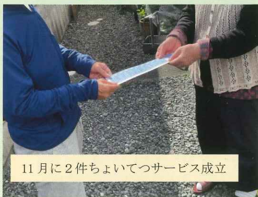
11月に2件ちよいてつサービス成立