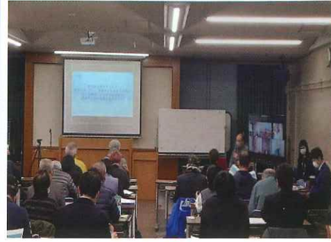
【日吉自治会】 ・毎月の組長会を年4回に軽減。 ・タブレット活用(ペーパーレス化)。