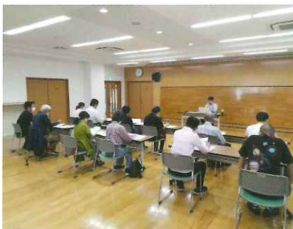
皆様、熱心に講座受講されていました。多数の方の登録ありがとうございます。

本事業を通して、①地域内での困り事がわかる。②地域住民同士の助け合い意識の醸成ができる。令和6年10月12日門池ちよいてつサービス養成講座が、13名の参加者と共に開催された。