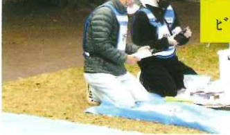
ビブス・ヘルメットの着用