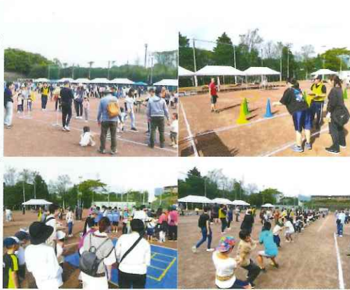
会場は、多くの老若男女の方々に賑わう

〔ご家族お仲間と楽しい時間〕 令和6年10月27日門池中学校グラウンドで門池地区スポーツ祭が開催、子どもから高齢者までの幅広い世代が楽しめる6種目のイベントゲームに挑戦していただきました。