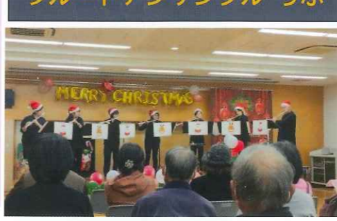
皆さんがご存知の曲をたくさん演奏します