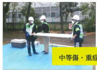
中等傷・重症患者