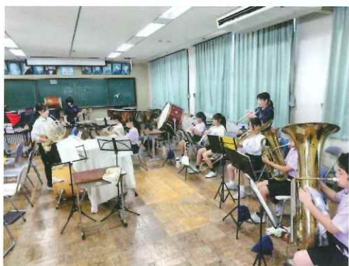
門池中学校部活動の地域移行のため、実証実験中の吹奏楽部です。

令和7年度学校運営の『プランデザイン』策定に向けて、地域教育に関する包括連携を前提に、学校から地域学習プラン、地域から青少年健全育成事業(案)を協議し、子供を核とした学校づくり地域づくりを目指して参ります。