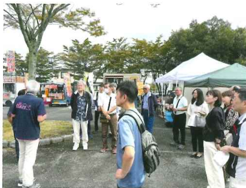
温かく迎え入れていただきました。 ありがとうございました。

〔他の市町村の事業を参考に〕 令和6年10月6日富士市松野地区まちづくり協議会を訪ねた。