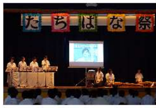
琴・ハンドベル演奏