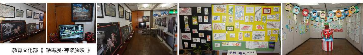
教育文化部《絵馬展・神楽放映》

平成28年10月27日(木曜日)沼津市のバスを利用して、静岡県地震防災センターを視察研修で訪れました。参加者は20名でした。 地震の知識や心得または防災対策について講話や体験を通して学ぶことができました。 特に津波シアターでの映像はショッキングでした。自分や家族の命を守るために「平常時の今やっておかなければならないことは何か」を今一度問い直すことが重要であると痛感しました。