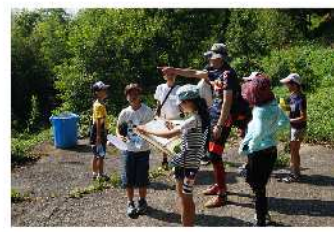
「久連」避難場所確認