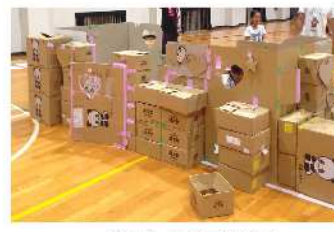
ダンボール居住設営

舎内の地震発生時の危険箇所調査」中高学年は「久連地区の地震発生時の危険箇所を調査」その後「地震津波ハザードマップ」を作成、食事はハイゼックス袋を使用した非常食を準備から配膳まで子供達が行い、夜はダンボールを使用した居住設営し避難生活を体験しました。