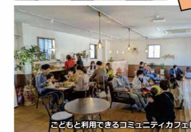
子どもと利用できるコミュニティカフェに