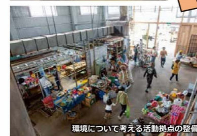
環境について考える活動拠点の整備