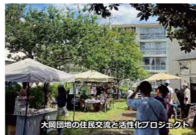
大岡団地の住民交流と活性化プロジェクト