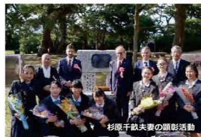
杉原千畝夫妻の顕彰活動

※構成員全員が高校生以下の場合、18歳以上かつ高校生ではない責任者1人を別につけること。