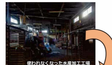
使われなくなった水産加工工場