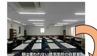
昼は使われない語学学校の自習室