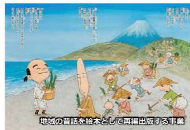
地域の昔話を絵本として再編出版する事業