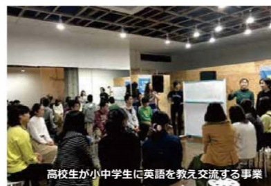
高校生が小中学生に英語を教え交流する事業