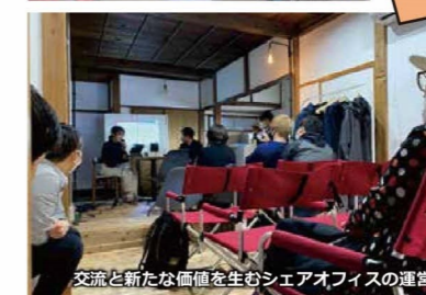
交流と新たな価値を生むシェアオフィスの運営