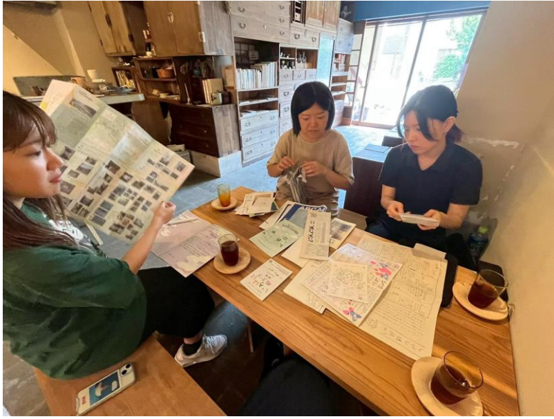
マップ制作にあたっての検討ミーティングの様子