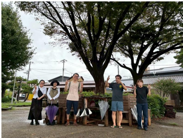
県外より来訪したアーティストと共に蛇松緑道を実際に歩きリサーチ活動を行う (アーツカウンシルしずおかのプログラムとの連携)