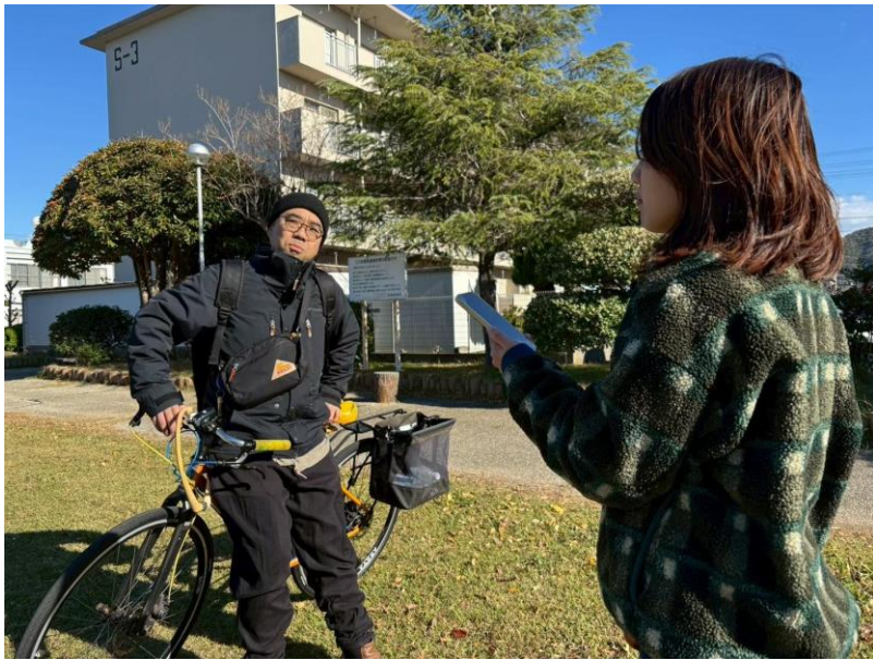
地域住民へのヒアリングの様子