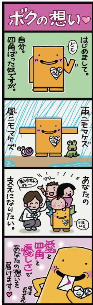
4コマ漫画 ヘレンまき