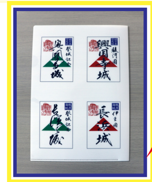
興国寺城跡・長浜城跡の 御城印クリアファイル!