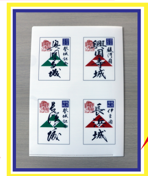
興国寺城跡・長浜城跡の 御城印クリアファイル!