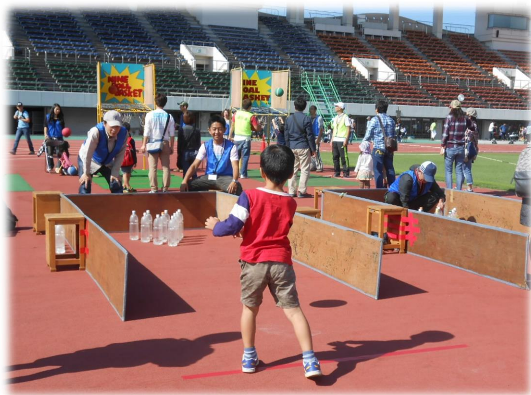
地域で学びを育てます 【子どもの遊び王国 in 沼津】

さらに、教育とまちづくりを連携させて相乗効果を図り、まちの主役である人を大切にするとともに、誰もが明るく生き生きと暮らせるまちづくりを目指すことが求められており、今後、「人づくりとまちづくりの一体的な推進」に取り組んでいきます。