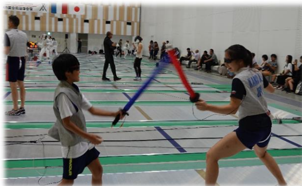
柔軟性のある安全な剣で私たちも楽しめます 【フェンシング女子フルーレ4カ国合同合宿】

そのため、各種スポーツ大会を支援するとともに、指導者の育成支援に努め、競技スポーツの人口の拡大や競技力の向上を図ります。