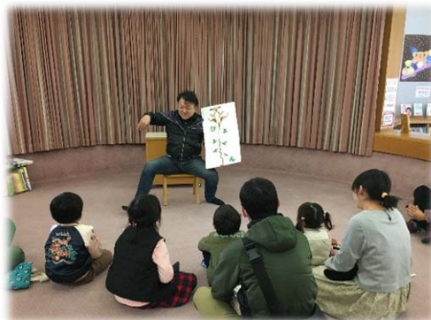
絵本の読み聞かせで本の楽しさを実感します 「ぴよよよーん」

そのため、発達段階に合った本を読む環境を整え、幅広い読書活動や豊かな読書経験を重ねていくことにより、自分とは違ったものの見方や考え方を広げたり身に付けたりしていくことが重要です。未来の担い手となる子供たちが、様々な情報や出来事を受け止め、判断する力を身に付けるために、読書はなくてはならないものであることから、自ら本に手を伸ばす子供たちを育てていきます。