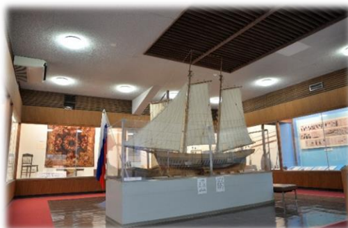
戸田造船郷土資料博物館