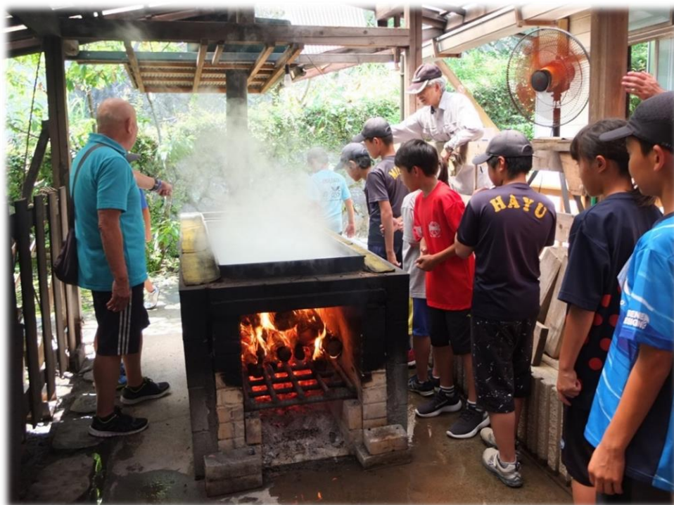
伝統製法の体験を通じてコミュニケーションを図ります 【戸田塩づくり体験】

また、心身ともに健全な青少年を育成するため、地域、関係機関と協力しながら、集団生活を送ったり、学習したりする機会を提供します。