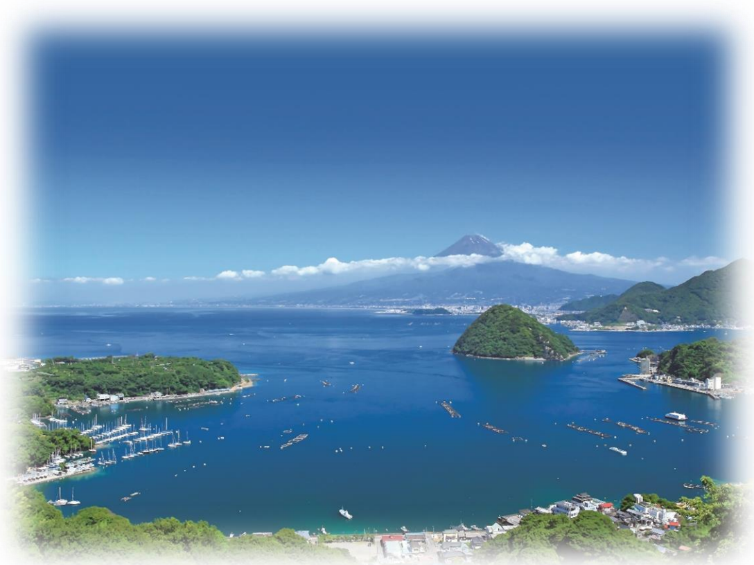
内浦重須見晴台から望む駿河湾越しの富士山

ここから更に南東に位置する達磨山からも、写真のような美しい景色を見渡すことができます。 達磨山から撮影された写真は、1939年（昭和14年）のニューヨーク万国博覧会に出品され、 世界中の人を魅了し、大好評を博しました。ぜひ一度、足を運んでみてはいかがでしょうか。