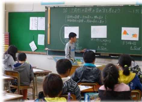
自分の言葉で考えを伝えます 「三角形の面積の求め方は…」

また、子供たちにとって、これからの世の中をたくましく生きていくためには、言語能力と同様、情報活用能力を育成していくことも重要です。情報活用能力は、世の中の様々な事象を情報とその結び付きとして捉え、情報及び情報技術を適切かつ効果的に活用して、問題を発見・解決したり自分の考えを形成したりしていくために必要な資質・能力です。将来の予測が難しい社会において、情報を主体的に捉えながら、何が重要かを考え、見出した情報を活用しながら他者と協働し、新たな価値の創造に挑んでいくために必要な力を育みます。