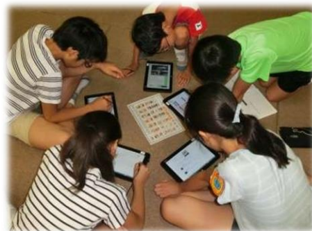
ICTの強みを学習に生かします 「これは何かな？調べてみよう」

そのため、1人1台端末及び高速大容量の通信ネットワーク等を有効活用するためのソフト面の充実や、教員のICTを活用した指導力の向上に努めます。