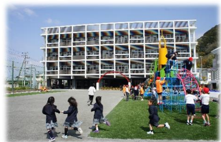
静浦小中一貫学校

また、小中一貫教育においては、各中学校区の特徴を生かしながら地域と連携し、諸活動における活発な小中学校の交流や、教員の積極的な乗り入れ授業等を通じて、小中9年間の学びの系統性・連続性を確保した教育課程を編成・実施します。