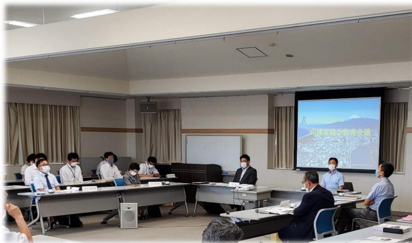
市長と教育委員会が教育行政について協議します 【総合教育会議】

構想の実現に向けて、「沼津市教育基本構想実施計画」に基づいて事業を実施するとともに、事務の点検評価による継続的な見直しや研究を行うことで、効果的な教育行政を推進します。また、想定を超える社会情勢の変化や危機事象に対応するため、教育における課題や施策について、教育委員会会議や総合教育会議の場における継続的な協議・検討を行うなど、適宜改善に努めます。