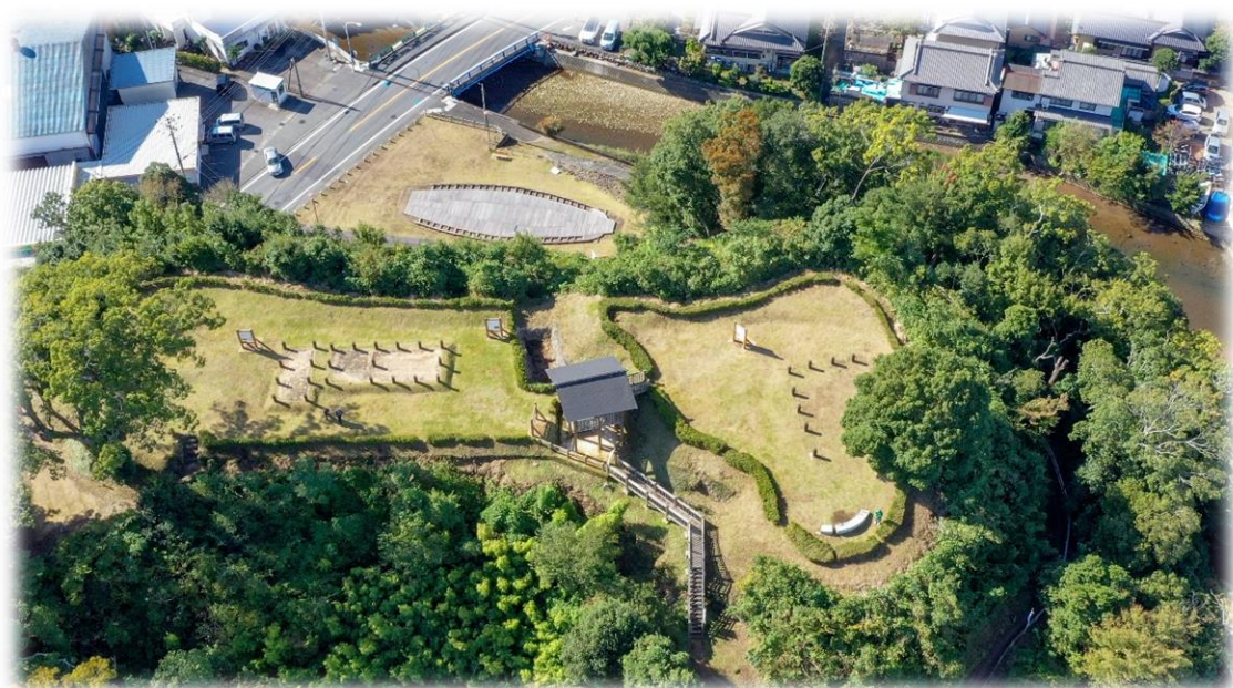
国指定史跡 長浜城跡

蔵文化財の出土遺物の公開なども含め、歴史資源の活用全般にわたり、中心的な役割を果たしていくことが期待されています。また、文化財センターのほか、登録博物館においては、史跡巡りや体験学習、地域の施設での出張展示をするなど文化財に触れる機会を提供します。さらに、学校や地域と連携して、文化財の魅力や歴史的な価値を多くの市民に向け啓発することにより、将来にわたって文化財を守り管理するとともに、活用していく担い手の育成に取り組みます。