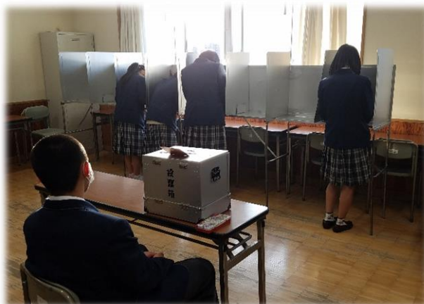
主権者としての意識を高めます 【社会科・公民（模擬投票）】

成年年齢が18歳に引き下げられることを踏まえ、単に政治の仕組みについて必要な知識を習得することにとどまらず、主権者として社会の中で自立し、他者と連携・協働しながら、社会を生き抜く力や、地域の課題解決を社会の構成員の一人として主体的に担うことができる力を身に付ける必要があります。