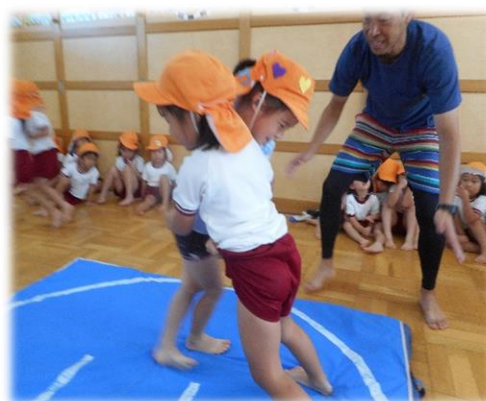
楽しく遊びながら学びを深めます 「はっきよーい、のこった！」

子ども・子育て支援新制度 ※4 においては、教育や保育、地域の子育て支援の質の向上などを進めていくことが求められています。幼稚園、保育所、認定こども園等においては、施設設備や教材準備など、計画的に構成された教育環境のもとで、幼児の自発的な遊びや、体験を通じた学びの十分な確保に努めます。