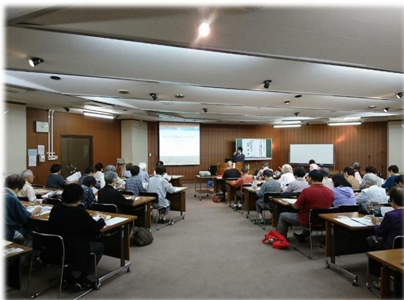
消費者教育などの暮らしに役立つ知識を学びます 【くらしのセミナー】

消費生活に関する社会問題が深刻化する中、自立した消費者として、安全・安心で豊かな消費生活を営むためには、消費者の権利と責任について理解するとともに、消費生活に関する的確な判断力を身に付け、主体的に判断し責任を持って行動できる消費者を育成する必要があります。そのため、あらゆる年齢層の市民を対象として、行政、学校、地域、事業者等と連携・協働し、消費者教育の推進を図ります。