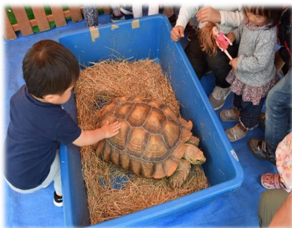
動物との触れ合いは豊かな情操を育みます 【沼津こいのぼりフェスティバル（移動動物園）】

これらのことから、知、徳、体、すなわち人間力を磨き、それらをバランスよく兼ね備えることが重要であり、系統的、継続的、かつ横断的な視点で、本市における教育を推進していきます。