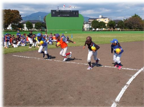
様々なスポーツの少年団員が 親交を深めます 【沼津市スポーツ少年団大会】

さらに、関係団体と連携をとりながら、指導者育成の支援、ボランティアが活動できる場や情報の提供などを通して、スポーツ活動を支える人材の育成や活動の充実を図ります。