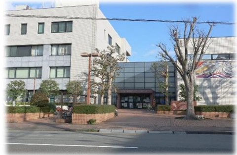
青少年教育センター

さらに、不登校が長期化してしまった子供や社会との関わりが少なくなっている青少年に対しては、青少年教育センターや民間のフリースクール等との連携や、ICTを活用した学習機会の確保など、進路指導も含めた社会的自立を目指した対応に努めます。