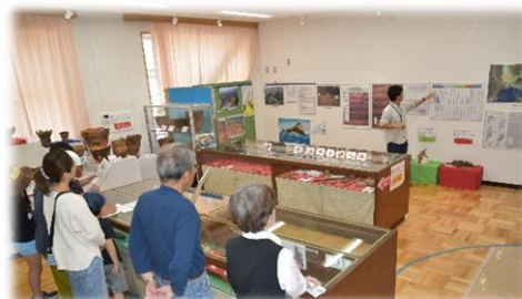
文化風土を学ぶ機会を提供します 【沼津の文化財を学んでみよう！】

また、このような地域特有の文化風土を、後世に継承していくためにも、学校教育や出前講座などにおいて、これらの文化資源を活用して、地域に根ざしたものとして学んでいく機会を提供します。