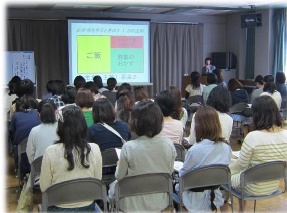
様々な分野における一流の講師から学びます 【沼津市民大学】

そのため、市民の学習ニーズを積極的に把握し、幅広い学習機会を提供するとともに、地域のあらゆる立場・世代の市民と協働して、それぞれの学習により習得した知識・技能が広く生かされる仕組みを構築します。