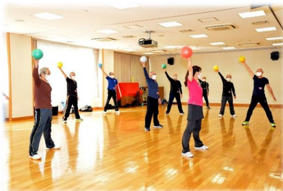
ボールを使った運動で健康の増進を図ります 【健康づくり教室】

高齢者の学習意欲に応えるとともに、高齢者が明るく健康的な生活を送るため、高齢者学級を開設し、学ぶ環境を整備するほか、高齢者自身の豊かな知識・技術・経験を学校や地域の活動の中で生かすことができる環境を整備します。