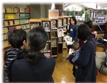
図書館の蔵書案内

そのため、他の社会教育施設や近隣図書館との連携を推進するほか、ICTを活用した新たなサービスの導入、幅広い活用方法など、市民の生涯学習活動を支援