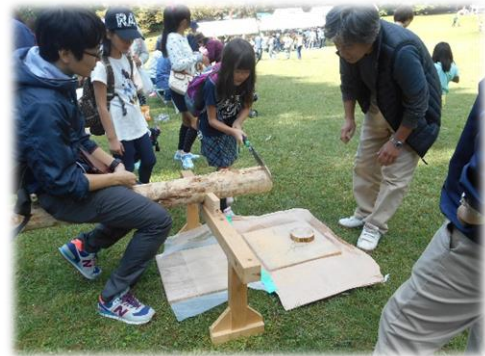
大人の指導で丸太切りを体験します 【子どもの遊び王国 in 沼津】

また、社会全体で幼児期の健やかな成長を支援できるよう、各園等と地域社会との連携を図ります。