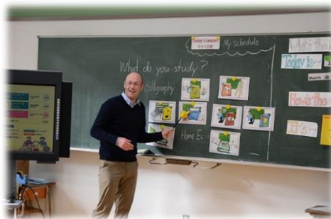
本場の発音に触れながら 国際理解を深めます 「What do you study?」

そのため、英語をはじめとする外国語教育の推進に努めるとともに、体験的な学習や問題解決的な学習などを通して、物事に柔軟に対処する力や、論理的に表現する能力、コミュニケーション能力等を身に付けられるよう、学びの広がりや深まりのある授業づくりに努めていきます。