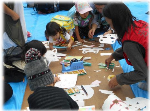
遊びを通して自我を形成します 【子どもの遊び王国 in 沼津】