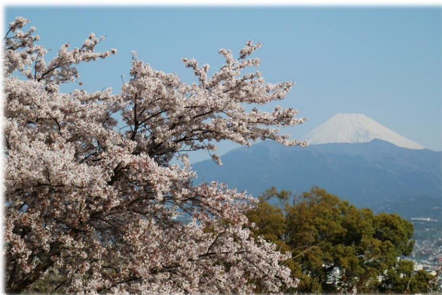
香貫山から望む桜越しの富士山

これからは、一人一人の夢の実現にとどまらず、あらゆる場所で挑戦し続け、「沼津を愛し、誇りを持ち、自分自身が関わって社会を変えていく」というシビックプライドを持った、「貴き志を持つ人」の育成を進めていきます。