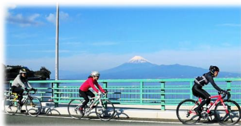
海沿いをサイクリング

本市は、海・山・川の自然や沼津御用邸記念公園をはじめとする歴史・文化資源など、宝といえる地域資源を数多く有しています。そして、これらの宝は、魅力的なアクティビティや、海の幸、山の幸などの豊かな食文化を生み出しています。