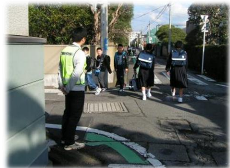
登下校の見守り活動

そのため、これらの取組と教育との連携施策として、学校を地域の防災拠点とした家庭、地域との合同防災訓練を実施するなど、子供から高齢者まで市民一人一人の防災意識を高めるとともに、学校、家庭、地域、関係機関の連携により通学路の点検や登下校の指導を実施するなど、交通事故から市民の命を守るための交通マナーや交通安全意識の向上を図ります。