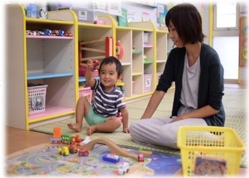
保護者との触れ合いが 自尊感情や自己肯定感を高めます 「これ、なあに？」

そのため、子供たちが様々な体験を通じて成就感や達成感を味わい、それを他者から認められたり、ほめられたりするような場を設定することで、自己肯定感を高めていきます。