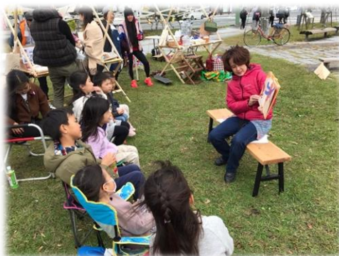
青空の下、絵本を読み聞かせます 【arcomichi (アルコミチ)】

子供が最初に出会う本は絵本であると言われていています。保護者が読み聞かせをしたり、一緒に本を読んだりすることによって、子供は読書習慣を確立していきます。本を通じて子供たちは言葉を学び、創造力や感受性を豊かにします。家庭においては、本に親しみ読書の楽しさを子供が実感できるようにすることが重要です。