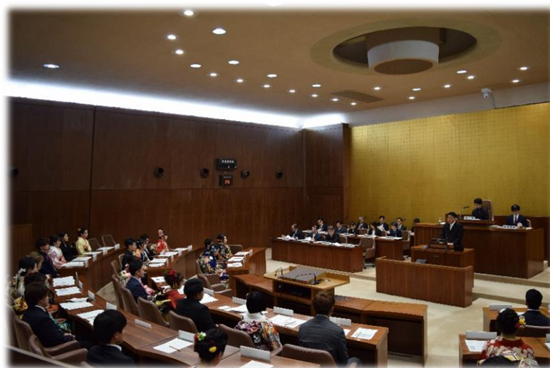
新成人の有権者としての自覚や市政に対する関心を喚起します 【新成人議会】

青少年の健全育成に向けて、地域ぐるみの活動が必要であることから、家庭、地域、行政、関係機関等が連携・協力し、青少年の非行防止や、健全育成の総合的施策、実践活動の方策等について、研究協議を進めるとともに、地域と密着した教育相談や補導活動を実施します。