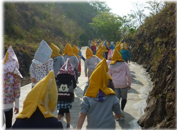
自ら考え、判断し、行動する力を身に付けます 【避難訓練】

また、学校は地域の避難場所の拠点としての機能を有することから、安全面を何よりも重視し、十分な強度の施設の維持管理、非常食の備え、防災用品の整備など、防災環境を充実させるとともに、防災訓練を家庭、地域と合同で実施するなど連携を図り、防災意識の高揚に努めます。