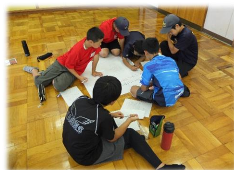
みんなの意見をまとめます 【沼津市フレッシュリーダー講習会】

さらに、子供たちが、社会の激しい変化やグローバル化の進展に対応して生きていくためには、言語能力や情報活用能力と同様、問題発見・解決能力の育成も重要です。既存の知識や技能を活用するだけではなく、未知の課題に対して様々な情報や出来事を受け止め、主体的に判断し、他者と協働しながら課題を解決していくための力が必要です。