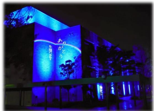
医療従事者を始め、最前線で感染症と戦う 全ての方へ、感謝と応援を贈ります 【ブルーライトアップ・メッセージ】

近年、地球温暖化の影響で、40℃を超える酷暑による熱中症などの健康被害や、ゲリラ豪雨などの異常気象による河川の氾濫、土砂災害を原因とする事故などが頻発しています。また、子供や不特定多数を狙った犯罪、ウイルスの変異による感染症、集団食中毒など、市民の生命や生活を脅かす危機事象が相次いでおり、その対応が求められています。