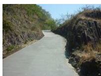
避難路舗装の状況

平成 24 年 3 月に避難路の舗装整備が完了し、子どもたちがより迅速・安全に敷地東側の高台へ避難できるようになりました。