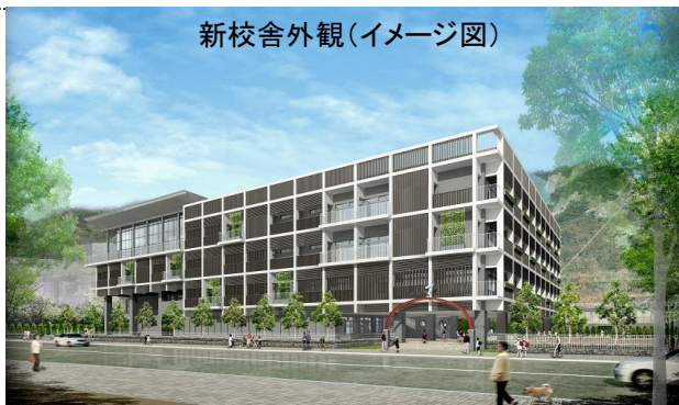
新校舎外観(イメージ図)