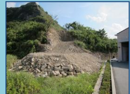
H24.9 避難路の整備状況

完成した校舎側の避難路に続き、大グラウンド側の整備に着手しています。静浦分遣所の背後を通る経路で、今年 12 月の大グラウンドの使用開始までには、整備を終える予定です。