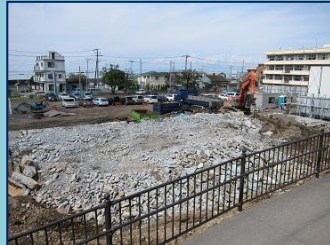
H24.9 既存プール解体状況

平成 24 年 10 月から平成 25 年 12 月にかけて新校舎の建設工事を予定しています。現在、建設工事に入る前の準備工事として、既存のプールや防球ネット等の解体工事を行っています。騒音等によりご迷惑をおかけしますが、ご理解とご協力をお願いします。