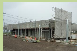
H24.9 体育器具庫の状況

【お詫び】 9 月～11 月までの約 3 ヶ月、屋外グラウンドが使用できず、子どもたちに不自由な思いをさせており、申し訳ありません。早く使用が開始できるよう努めています。