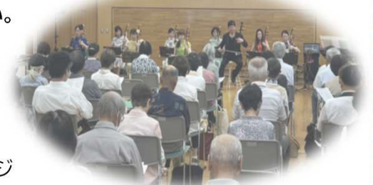
『二胡コンサート』の様子