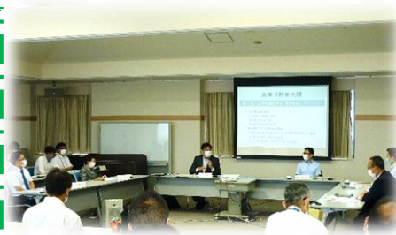
総合教育会議の様子