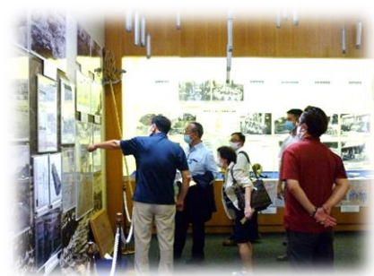
明治史料館見学の様子