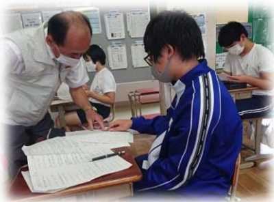
沼津寺子屋の様子

令和2年7月1日、教育大綱の素案と、重点教育施策について、市長と協議を行いました。教育大綱については、「人間力を磨く教育」「地域総がかりで取り組む教育」という二つの基本方針に対して市長に提言しました。パブリックコメントも終了し、10月の第2回総合教育会議を経て、市長が教育大綱を決定します。 重点教育施策については、臨時休業中の対応を振り返り、新型コロナウイルス感染症により可視化された課題について意見交換を行いました。