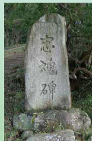
忠魂碑 大正13年(1924) → 鷺頭神社