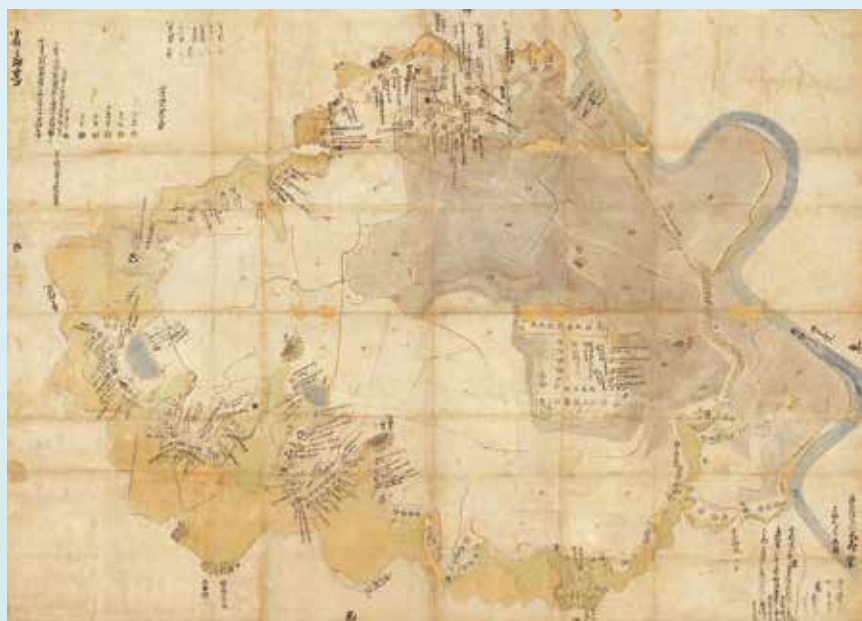
駿州駿河郡大平村絵図 沼津市指定文化財 元禄5年(1692)9月 桃源院所蔵

みなさまが生活している身近なところにも先人たちが生き、歴史を残してきたことを知っていただき、地域の誇りとしていただければ幸いです。