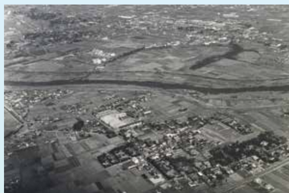
空から見た大平 昭和53年(1978)3月1日撮影 沼津市立大平小学校所蔵