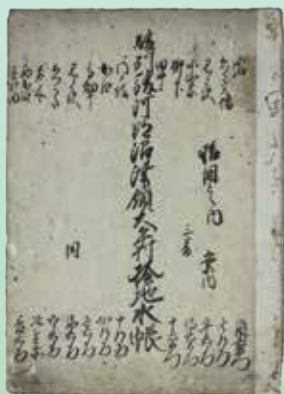
駿州駿河郡沼津領 大平村検地水帳 延宝2年(1674)2月24日