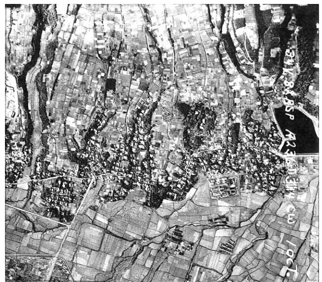
米軍空中写真 昭和22年10月撮影

一方、列状を成す「列村」では機能や発達の歴史過程、さらには規模により「街村」と「路村」に大別される。集村型のうち1本の道路を挟んで、片側ないし両側に家屋が配列された事例である。道路への依存度が高い「街村」は、旧東海道沿いの平町以西のように、間口が狭く奥行の長い家屋が密集して都市的性格を示し、商業的交通の機能が強く、宿場町などの人為的に作られたものが多い。もう一方の「路村」は、概して自然発生的なもので農漁村に見られ、根方街道や上石田のように道への依存度が低く、家屋配列も粗い。