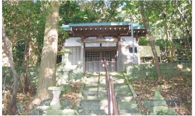
下香貫大久保 瓦山神社

九十九折りの山道を30分ほど登ると標高175mの志下坂峠に至ります。さらに峠を越えて北に下ると大平の大井の集落へと続いています。静浦と大平から田方方面を結ぶ大切な峠道でした。