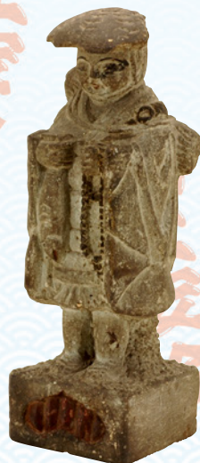
さば 鯖大師像 当館所蔵