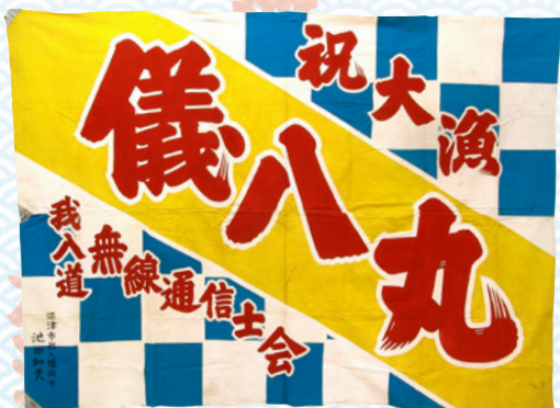
フライキ (大漁旗) 当館所蔵