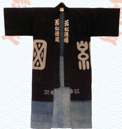
マイワイドテラ 当館所蔵