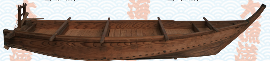
静岡県指定文化財 大瀬神社奉納漁船模型 大瀬神社所蔵