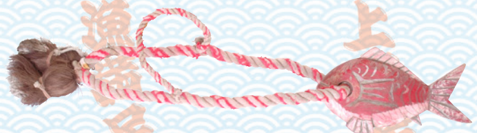
ハチマキ (船首飾り)