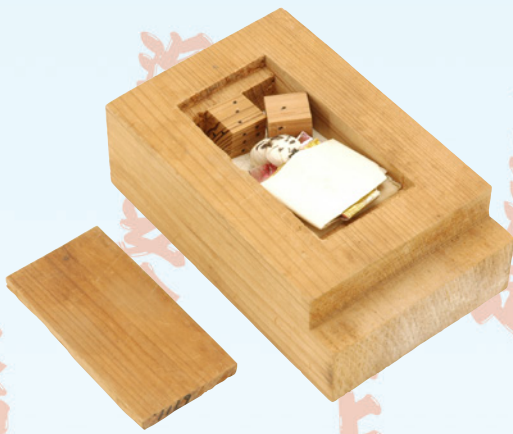
フナダミサン (船靈) 当館所蔵