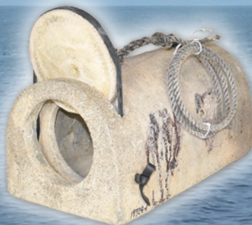
タコツボ(タコツボ漁)