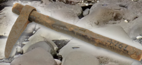
カキトリ(牡蠣採取)