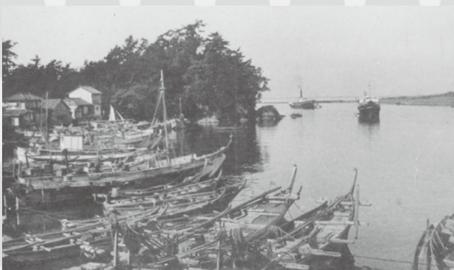
かにゅうどう (沼津静浦風景) 我入道港