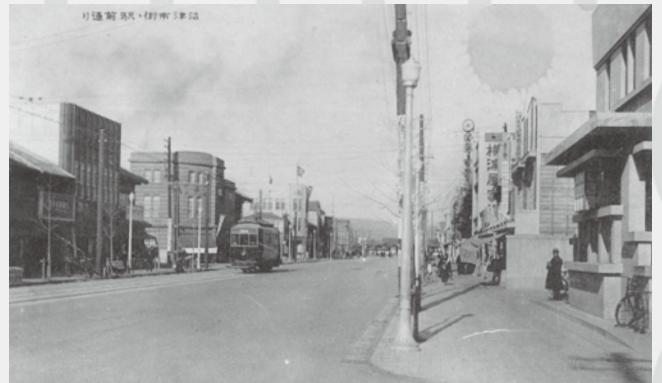
沼津市街・駅前通り