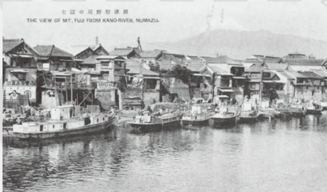
かの 沼津野川の富士