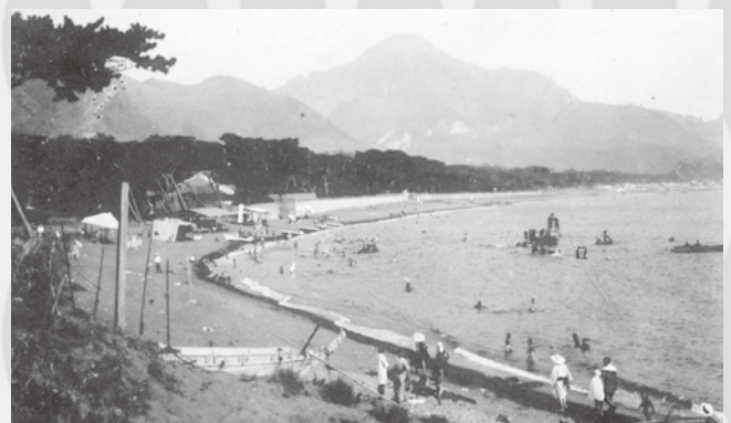
とうごう 桃郷御用邸裏海水浴場