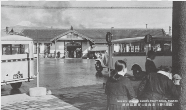
ようしゅう (沼津名勝) 東海道の要衝沼津駅