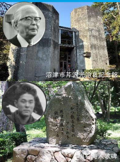
沼津市芹沢光治良記念館