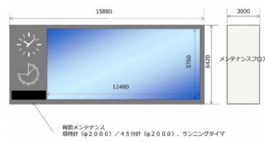
図3 大型映像装置立面図