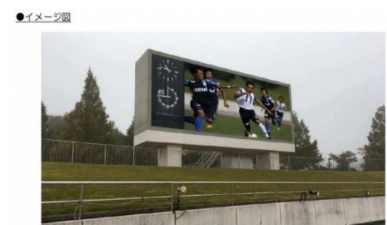
図4 大型映像装置イメージ図