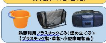
熱源利用プラスチックごみ(埋め立て③)