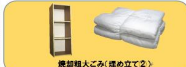
焼却粗大ごみ(埋め立て②)