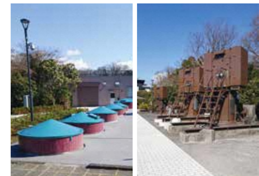
（左）深井戸 （右）送水ポンプ450kw（1台）・270kw（3台）