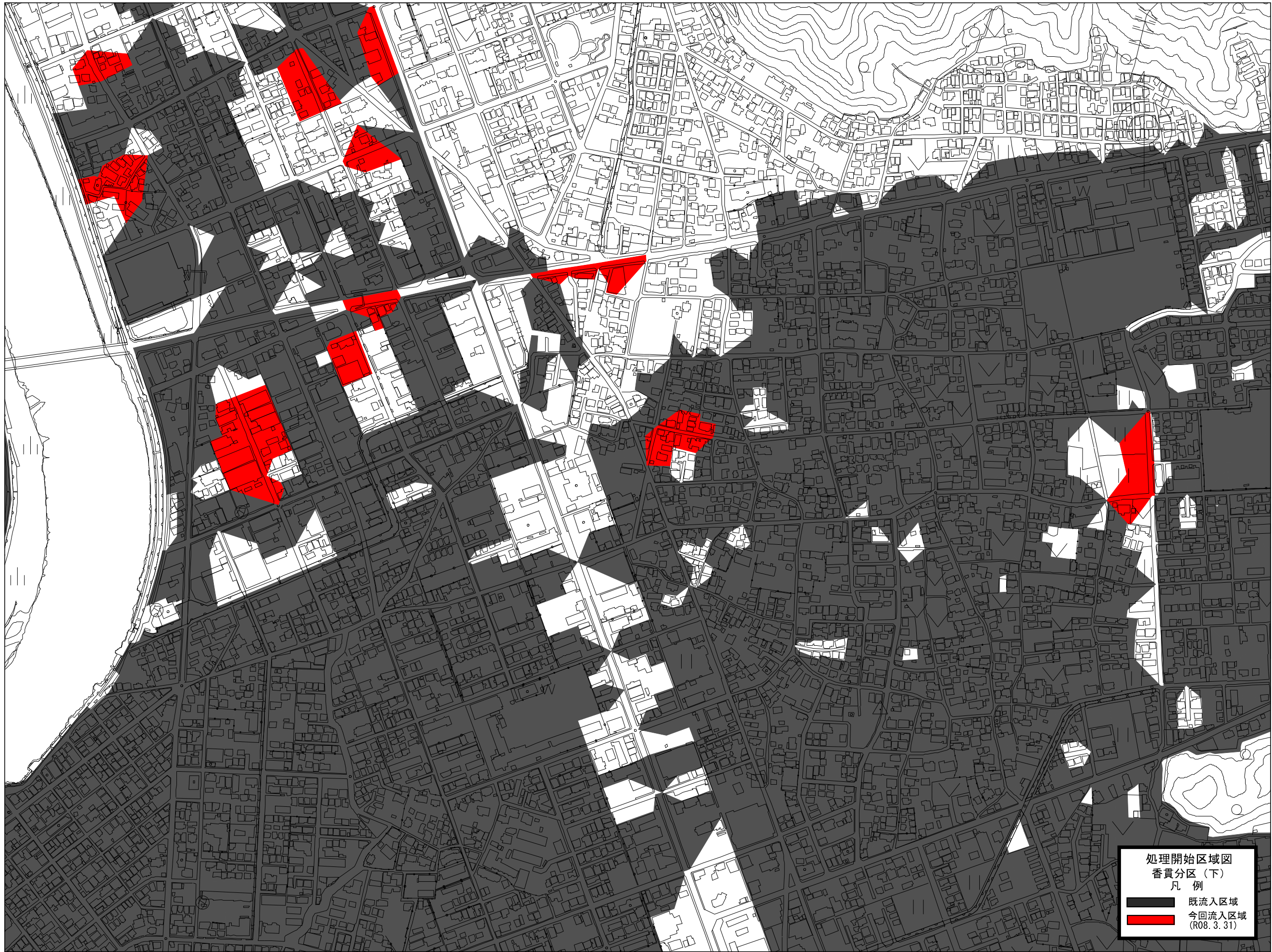
[ 香貫分区 (下) ]