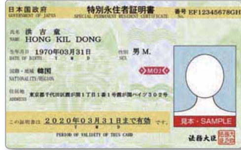
特別永住者証明書