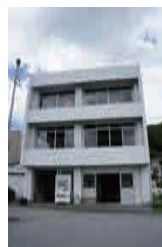
O.F.C (オー・エフ・シー) TEL・055-919-4041 沼津市江浦 170-12