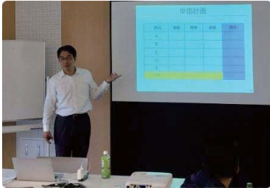
事例を挙げたわかりやすく説明が好評