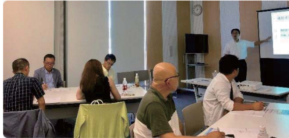
各自のビジネスモデルをシミュレーションしています