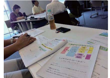
受講後のフォローも大好評でした