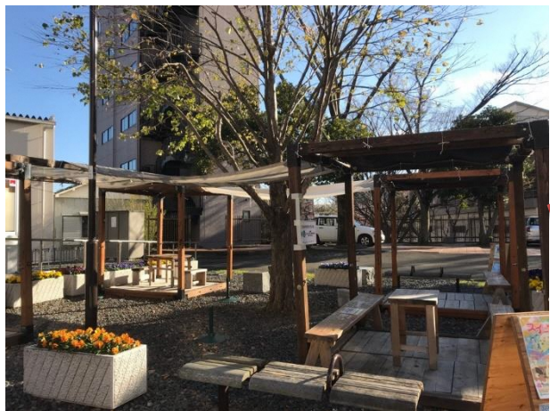
中央公園(4台) ヌマヅランニングスキルズステーション前