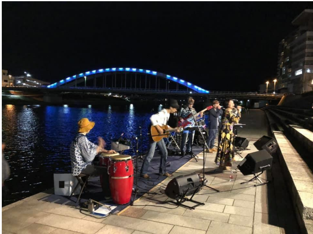
★狩野川ミュージックフェスタ VOL11, VOL12 のチラシ