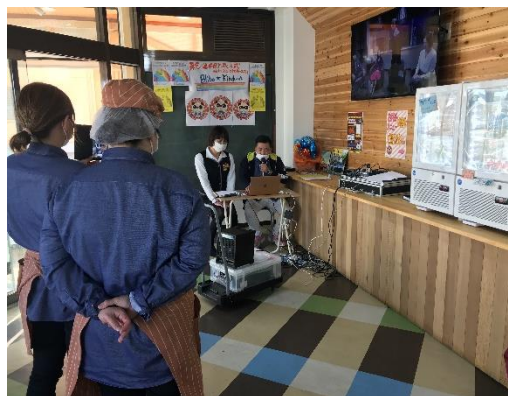
LGBT 成人式にサテライト会場で相談者、企業サポーター、来店者とともに参加。