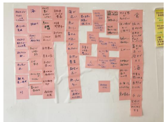
◎2月19日(金) 18時半～21時半 会場 井草呉服店